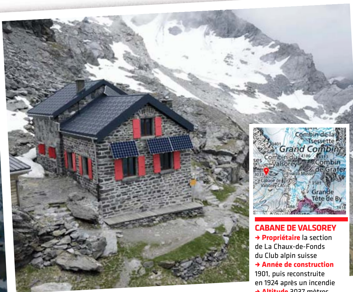
Construite en 1901, la cabane de Valsorey appartient à la section de la Chaux-de-Fonds du Club Alpin Suisse.