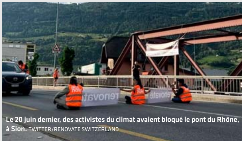
Le 20 juin dernier, des activistes du climat avaient bloqué le pont du Rhône, à Sion.

« Dans une démocratie directe telle que la nôtre, où chacun peut lancer